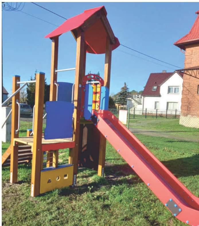
Plac zabaw w Tarnowie

Łączny koszt urządzeń to 31.709,40 zł, a kwota 30.000,00 zł została pokryta z środków finansowych pozyskanych w konkursie „Granty sołeckie 2022”.