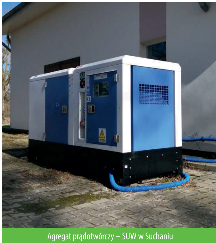
Agregat prądotwórczy – SUW w Suchaniu

Wartość zakupionych agregatów to 92.250,00 zł, zadanie zostało sfinansowane z budżetu gminy.