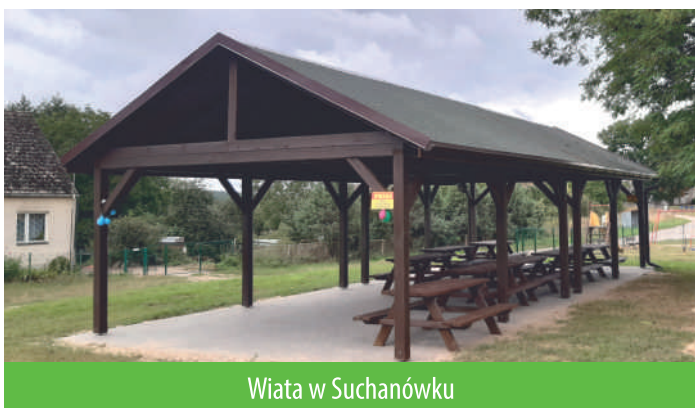
Wiata w Suchanówku

W Suchanówku wiaty stanęły w pobliżu boiska do siatkówki, w Sadłowie w sąsiedztwie boiska do piłki nożnej. Wartość zakończonych projektów – 137.091,00 zł, z czego środki w wysokości 49.835 zł na budowę wiat w Sadłowie zostały pozyskane w ramach projektu grantowego realizowanego przez Stowarzyszenie „WIR” – Wiejska Inicjatywa Rozwoju.