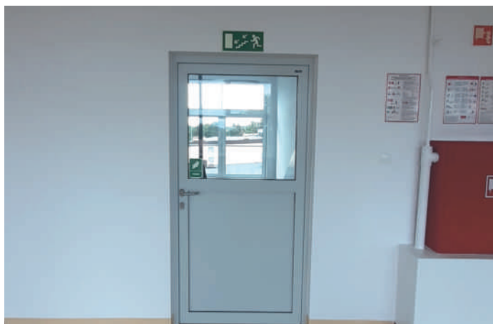
Zmodernizowana klatka schodowa

Na wykonanie tego zadania Burmistrz Suchania wydatkowała środki z budżetu gminy w wysokości 440.683,01 zł.