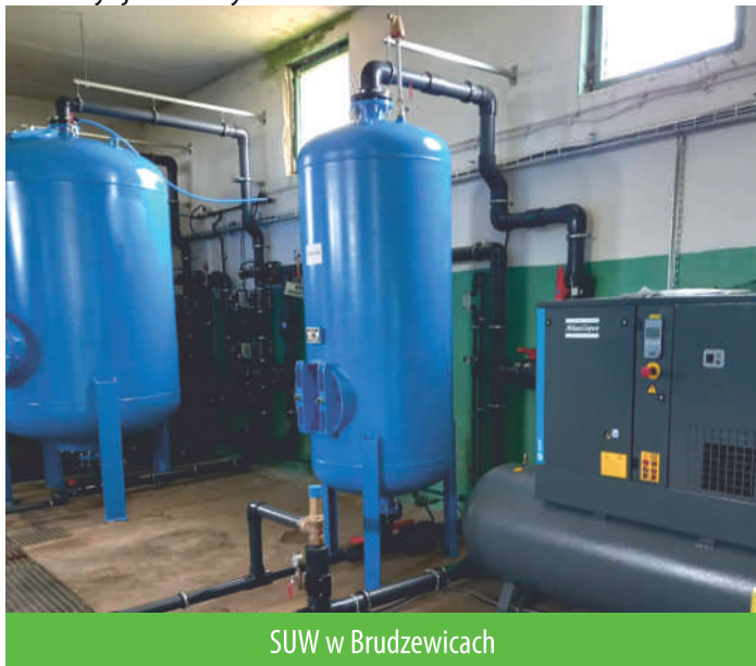
SUW w Brudzewicach

Całkowity koszt zadania wyniósł 618.695,00 zł, otrzymane dofinansowanie na jego realizację w wysokości 525.534,96 zł pochodziło z Rządowego Funduszu Inwestycji Lokalnych.