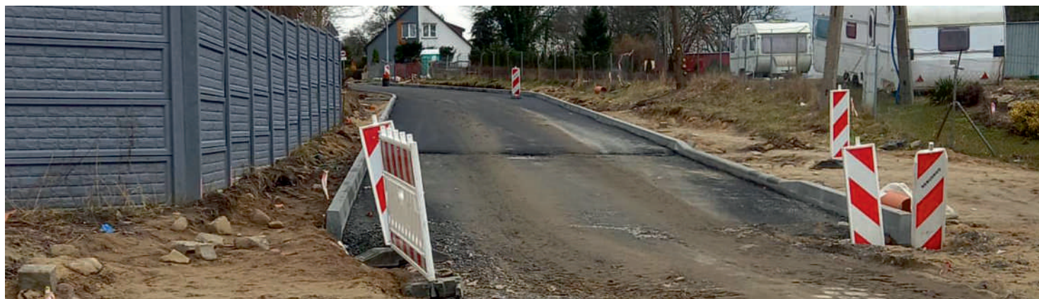
Droga gminna w Wapnicy

1. Trwają prace związane z Przebudową drogi gminnej w miejscowości Wapnica , na działkach 222/86, 243, 294/1 i 755. Łącznie przebudowany zostanie odcinek drogi o długości ok. 515 m. W ramach prac zostanie wykonana nawierzchnia drogi z mas mineralno-bitumicznych, a zjazdy do posesji z brukowej kostki betonowej. Na tym odcinku zostanie również przebudowana kanalizacja deszczowa. Wartość trwających prac to 2.547.940,10 zł.