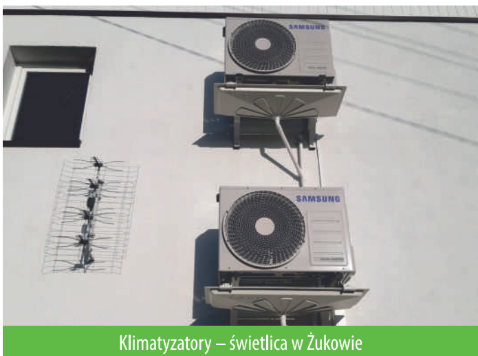
Klimatyzatory – świetlica w Żukowie

W budynkach świetlic w Brudzewicach i Żukowie zostały zamontowane klimatyzatory z funkcją grzania i panele na podczerwień. Na to zadanie Burmistrz Suchania wydatkowała środki z budżetu gminy w wysokości 55.444,71 zł.