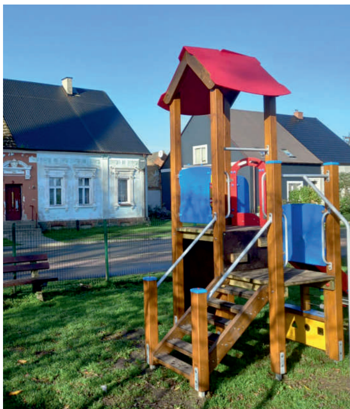
Plac zabaw w Sadłowie