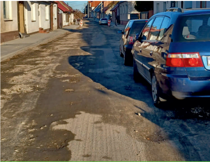
ul. K. A. Hlonda w Suchaniu

2. Dobiegają końca prace przy przebudowie ul. Kardynała Augusta Hlonda w Suchaniu, które są realizowane w ramach zadania „ Przebudowa dróg na terenie gminy Suchań w miejscowościach Suchań i Brudzewice ”.