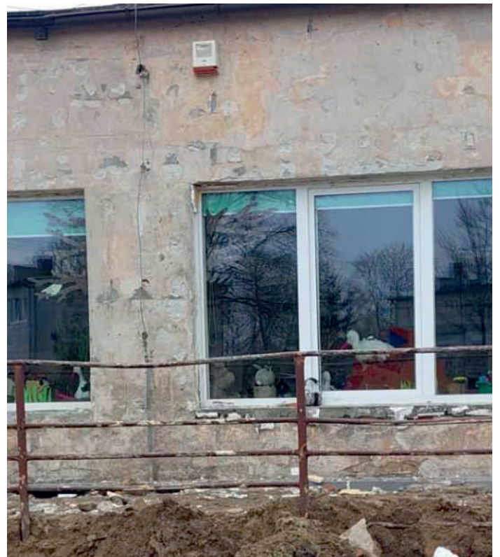
Świetlica w Wapnicy

Dodatkowo do atmosfery nie trafią substancje szkodliwe powstające przy spalaniu ekogroszku. Koszt instalacji pompy ciepła – 72.570,00 zł, a 68.781,85 zł będą stanowiły środki z Programu Rozwoju Obszarów Wiejskich.