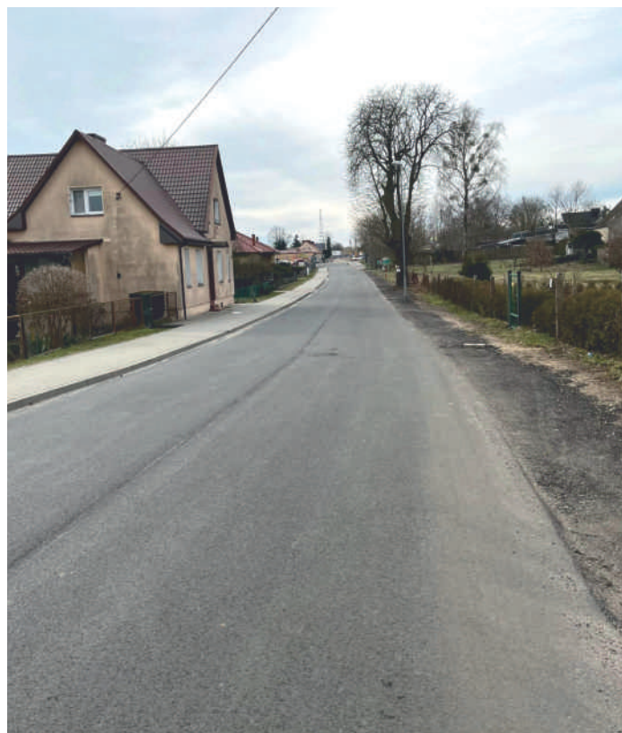
Droga powiatowa w Wapnicy

W ramach modernizacji na odcinku drogi od skrzyżowania z drogą krajową nr 10 do wyjazdu z miejscowości Wapnica w kierunku Dobrzan, została wykonana nowa nawierzchnia jezdni z mas mineralno-bitumicznych. Zadanie było realizowane przez Powiat Stargardzki, całkowity koszt to 727.419,39 zł.