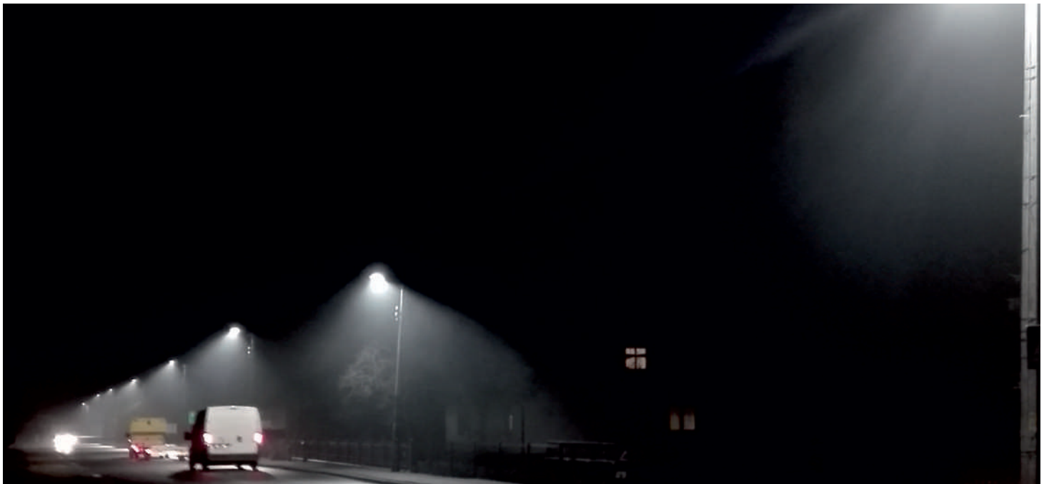
Oświetlenie LED w Suchaniu

Modernizacja i rozbudowa oświetlenia ulicznego o lampy solarne to kolejne z sukcesywnie realizowanych w naszej gminie działań, które mają na celu poprawę bezpieczeństwa, ale też oszczędność energii i obniżenie kosztów funkcjonowania oświetlenia ulicznego.