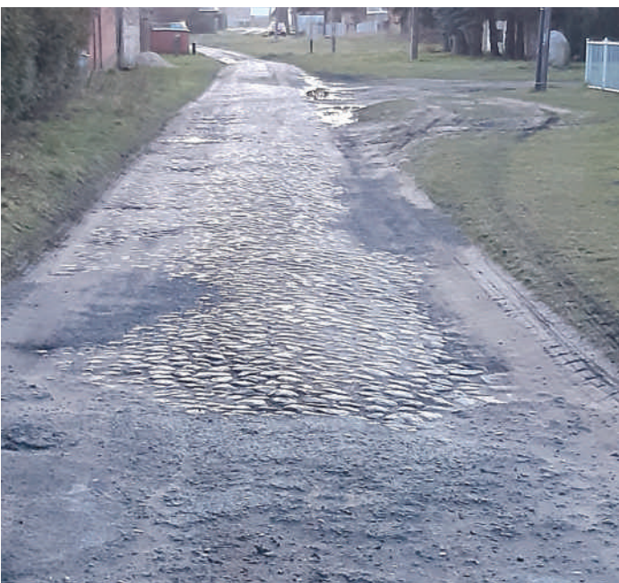
Droga w Żukowie planowana do przebudowy

3. W bieżącym roku planowana jest jeszcze Przebudowa drogi gminnej w miejscowości Żukowo . Łącznie przebudowane zostaną dwa odcinki drogi gminnej o długości ok. 487 m. Modernizowana będzie droga brukowa na odcinku od posesji nr 44 do 74 oraz odcinek w kierunku cmentarza od drogi brukowej do płyt betonowych. Droga zyska nawierzchnię z mas mineralno-bitumicznych, a pobocza zostaną utwardzone.