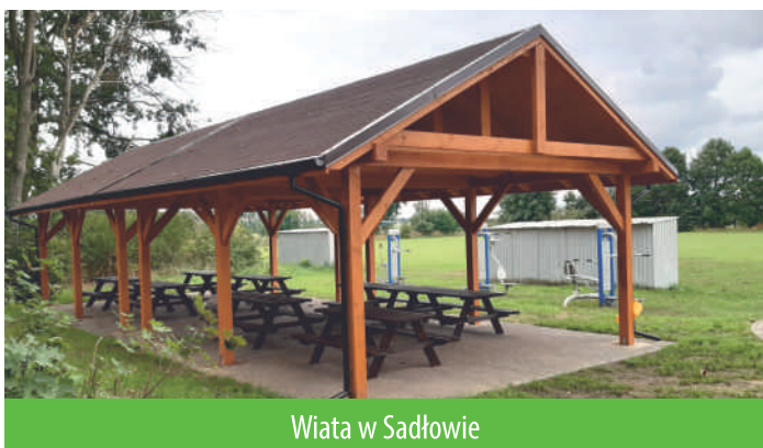
Wiata w Sadłowie