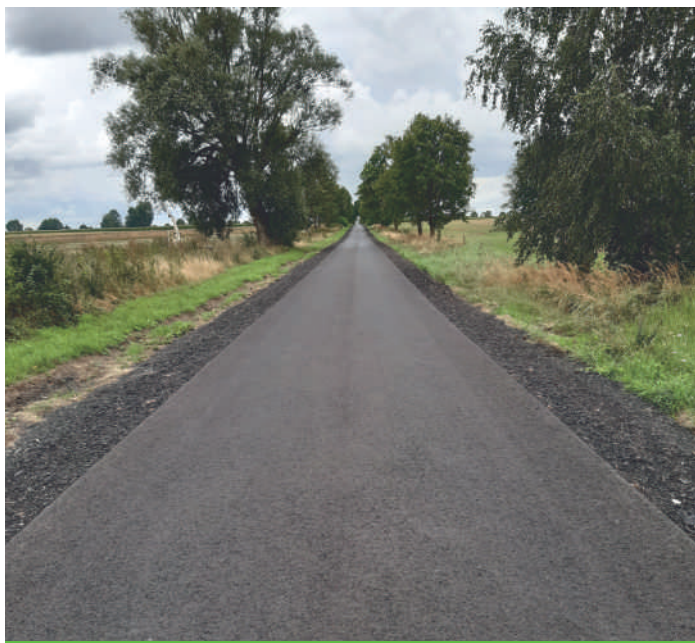
Droga do Suchanek

Na odcinku drogi o dł. 965 m została wykonana nowa nawierzchnia i utwardzono pobocza. Na realizację tego zadania Burmistrz Suchania otrzymała z Województwa Zachodniopomorskiego dotację w wysokości 479.443,17 zł, a całkowity koszt to 857.277,58 zł.